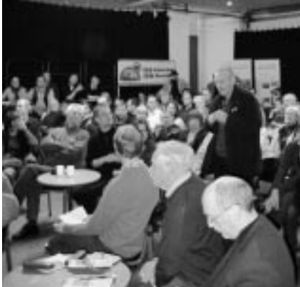
Das Publikum diskutiert mit

Ergänzt wurde von den anwesenden Bürgerinitiativen, wie zeitaufwändig und kostspielig es sei, sich in Planungsverfahren einzubringen - komplexe Sachlagen müssten von den engagierten Laien erst verstanden werden, teure Sachverständige beauftragt werden, um überhaupt mitreden zu können und mitreden zu dürfen.