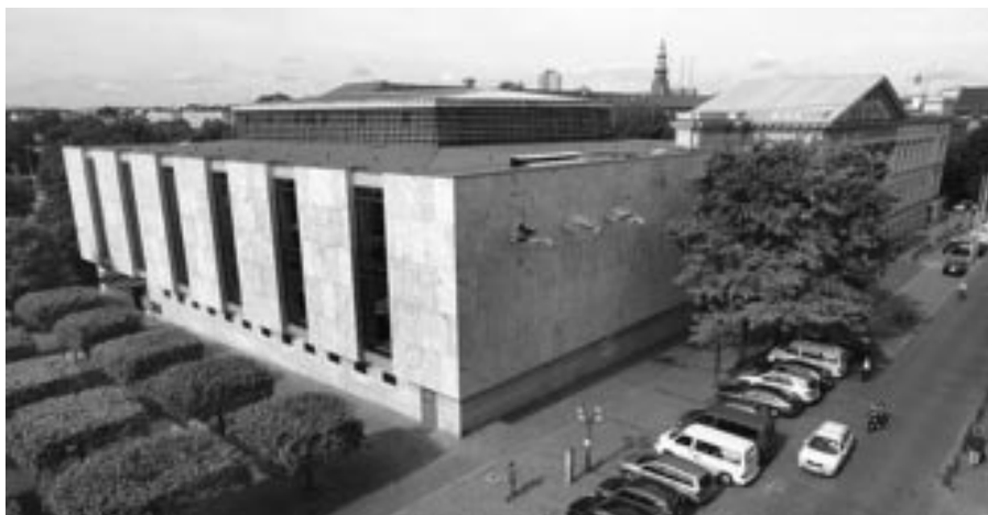
Plenarsaal des Niedersächsischen Landtags

vom Architekten Yi konkrete Pläne für ein neues Plenargebäude gibt, steht nach wie vor nicht fest, ob es tatsächlich zu einem Neubau kommen wird. Dagegen sprechen die zu hohen Kosten, die sich nach jüngsten Einschätzungen auf ca. 60 bis 65 Mio. Euro belaufen werden. Bei einem Neu-