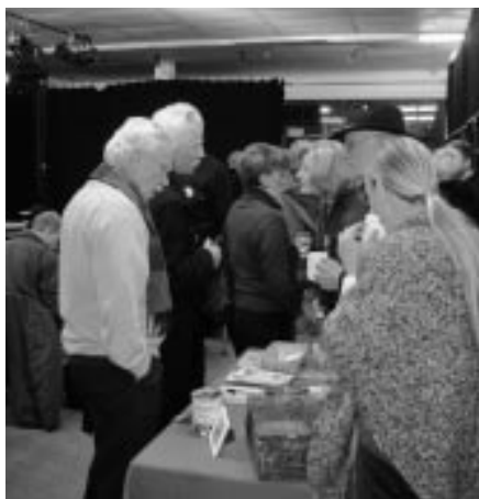
Die Bürgerinitiativen präsentieren sich

Mit Vertretern aus Politik, Wissenschaft, Bürgerinitiativen und dem Verein „Mehr Demokratie e.V.“ sollte in zwei Veranstaltungen im Pavillon der Frage nachgegangen und ausgelotet werden, wie und wo Bürger-Engagement und Verantwortung für das Gemeinwesen möglich und notwendig ist.