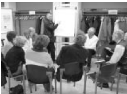
Zusammentragen der Ergebnisse

Ende des Abends, dass moderne Demokratien ohne Ideen und Kenntnisse (Beteiligung) der Bürger nicht auskommen. Die Politik sollte die Vorschläge und Wertungen engagierter BürgerInnen in Entscheidungsprozesse einbeziehen.